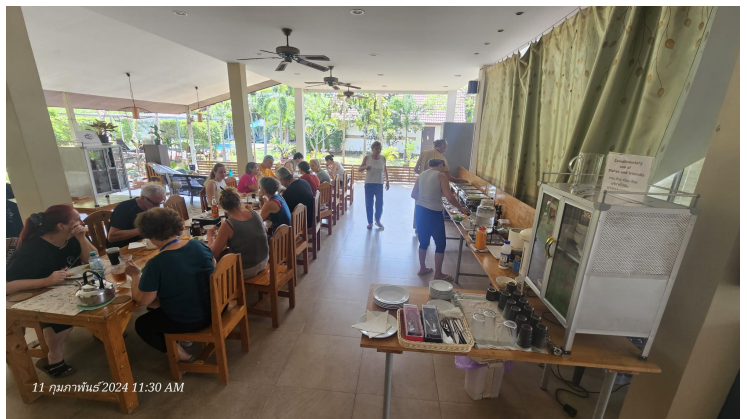
Da ist das „Hillside“ 😊